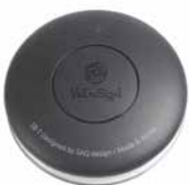
Service Knopf Premium 3-Taster